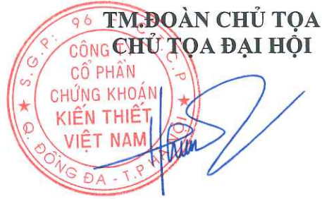
HOÀNG XUÂN HÙNG