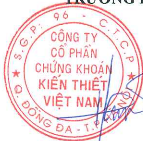
HOÀNG XUÂN HÙNG